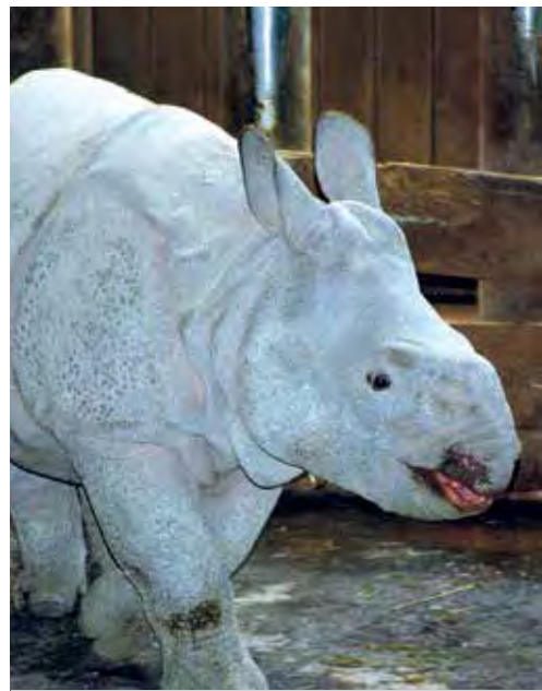
Růženka jsou teprve tři a půl měsíce a už chodí...

Už jsem u nás viděl mnoho zoologických zahrad, ale Plzeň má oproti jiným několik výhod. Za prvé – není tak velká, aby se nedala za den poměrně podrobně projít a prohlédnout. Důvodem je především přehlednost. Zvířata jsou představena v celcích odpovídajících zoogeografickým