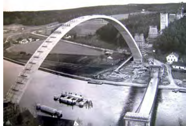
Stavba Podolského mostu – navštivte výstavu Brána do nebes.

I když je to trochu předčasné a většinou nás vánoční zboží, které se objeví na pultech obchodů se sklonkem léta, spíše rozladí, než navnadí, přesto si dovolueme poodhalit témata adventních a vánočních výstav. V Galerii letos nenajdete žádné nostalgické retro jako loni, ale prostor zaplní princezny, kašpárci či vodníci, které kdysi ve své mirotické dílně vyřezal Mikuláš Sychrovský (1802 – 1881). Podle data jeho narození je jasné, že půjde o loutky velmi staré, však je také Sychrovský prvním jménem známým výrobcem dřevěných herců v Čechách. Muzeum tak chce tomuto pracovitému řezbáři vzdát hold. Interaktivní výstava bude doplněná o další loutky ze sbírek muzea a školky i školy se opět můžou těšit na program k výstavě spojený s tematic-