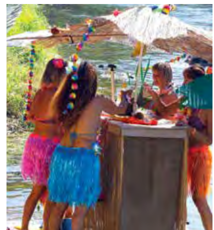
NECKYÁDA 2017 začíná v sobotu 26. srpna u pěší lávky na Portyči registrací účastníků, od 13 hodin následuje slavnostní start plavidel. Cílem bude i letos hospůdka U Sulana s bohatým programem.

O letních prázdninách se v Písku rozhodně nenudí ani ti, kteří neodjeli poznávat cizí kraje nebo zvelebovat rekreační chalupu. Stejně tak poutníci, kteří do města nad Otavou přijíždějí, si mohou vybrat z nabitého programu. Doporučujeme vám každý měsíc vyjmout si tento prostřední dvojlíst a vystavit si ho na nějaké dobře viditelné místo. A předem si v něm pořádně vyznačit akce, o které nechtete přijít. Aktuální informace a případné změny, které nám pořadatelé nahlásí, najdete na www.piseckysvet.cz .