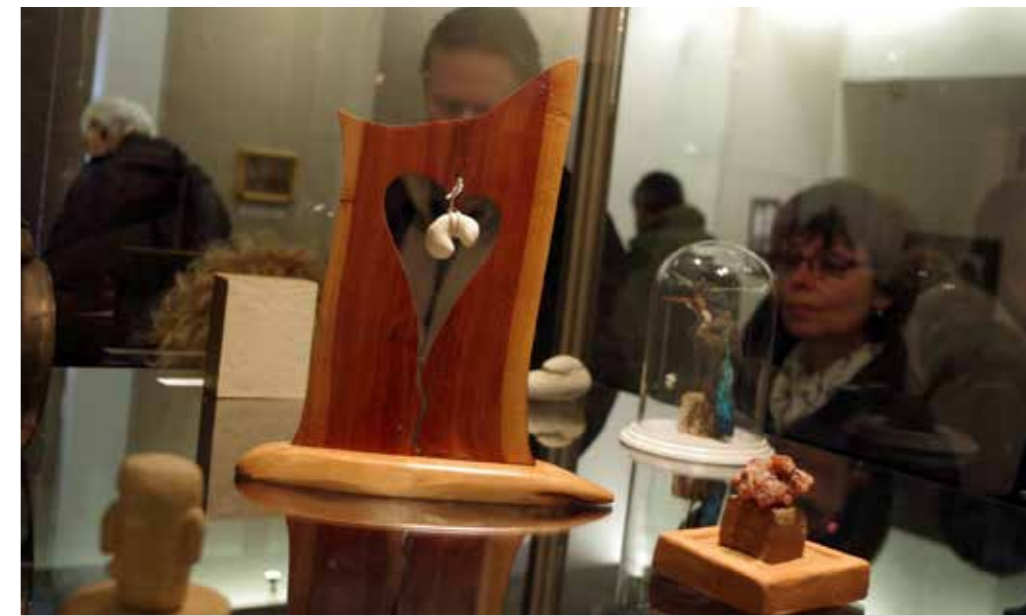
Z výstavy Kabinet kuriozit starého muzejníka. Více fotografií najdete na www.piseckysvet.cz .

Myslím, že snahy o ochranu přírody jsou potřebné, i když to katastrofu nezastaví. Možná zpomalí. Bohatí a mocní se nechtějí smířit se snahami občanů je jakkoli omezovat, třeba ochranou území nebo druhů. Oni mají tu moc si zákony upravit pro sebe. Právě jsem se z rádia doslechl, že naši kvótu přistěhovalců zvedli už na asi 1600 lidí. To je islamizace. Pokud k přijetí v Evropě