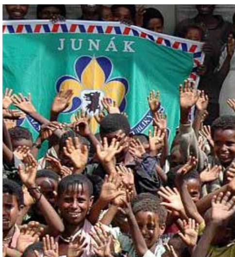
Nejúčinnější pomoc rozvojovému světu je přímá podpora v místě – foto ze společného projektu Junáka a Člověka v tísní Postavme školu v Africe

Přes naše území se – snad od dob třicetileté války – nikdy neprohnal větší válečný konflikt a jediná skutečná devastace se odehrála zejména v morální rovině během čtyřiceti let diktatury proletariátu, který každému diktoval starat se hlavně sám o sebe. Momentálně jsme součástí bohaté Evropy a patříme k zhruba 5% nejbohatších lidí na světě. Otázkou je, kde Evropa toto bohatství vzala: dalo by se do jisté míry spekulovat o tom, že jedním ze zdrojů naší momentální zámožnosti jsou staletí drancování kolonií na všech světadílech, kde se nyní rozkládá onen – pro nás tak vzdálený – třetí svět nebo rozvojové země. A v návaznosti na tuto úvahu by nás mohl zneklidnit pocit určitého dluhu, které vůči těmto zemím máme. Ale i bez něj si dovoluji zastávat myšlenku, že pravidelně odvádět část ze svých příjmů na pomoc těm méně šťastnějším, kteří se nenarodili v „zemském ráji na pohled“, by měla být běžná složka našeho života, normální věc, součást slušného vychování, zkrátka samozřejmost. Pár stovek – nebo i tisícovka – měsíčně málokoho vytrhne z pocitu sytosti, kterým se tak rádi opájíme. A kdo nemá ani stovku nazbyt, může dát třeba třicet korun. Peněz, které prolijeme hrdly v nálevnách nebo nádržích svých vozů, aniž bychom se nad tím pozastavili, je neměřitelně více.