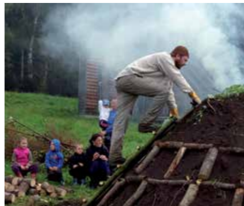
Jeden z bratrů Kmoškových právě zapálil milíř.

V rámci ukázek vyrábějí v dehtářské píce také vedlejší surovinu výroby dřevěného uhlí – dehet – černou mazlavou hmotu, která se