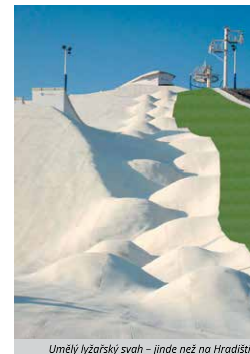
Umělý lyžařský svah – jinde než na Hradišti...

Cílem tohoto povídání o svahu není urážení ego či tak podobně, ale snaha alespoň naznačit varianty, co by šlo na svahu a v jeho nejbližším okolí realizovat a provozovat. Kdysi dávno pořádané závody na horských kolech mě inspirovaly natolik, že jsem začal v roce 2005 přemýšlet o tzv. startovací variantě, že by se na svahu přes jaro a léto vybudovala třeba dráha pro kola s klopkami, skoky apod. Nebo by zde mohla vzniknout dráha pro tubing, tak jako se to dělá už léta v alpských