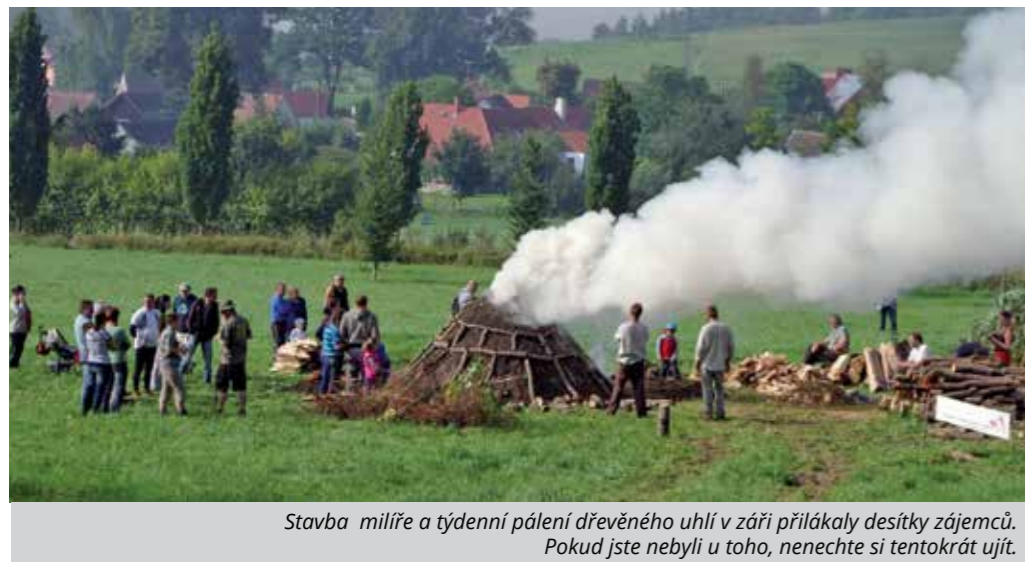
Stavba milíře a týdenní pálení dřevěného uhlí v září přilákaly desítky zájemců. Pokud jste nebyli u toho, nenechte si tentokrát ujít.