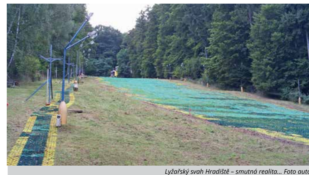
Lyžařský svah Hradiště – smutná realita...