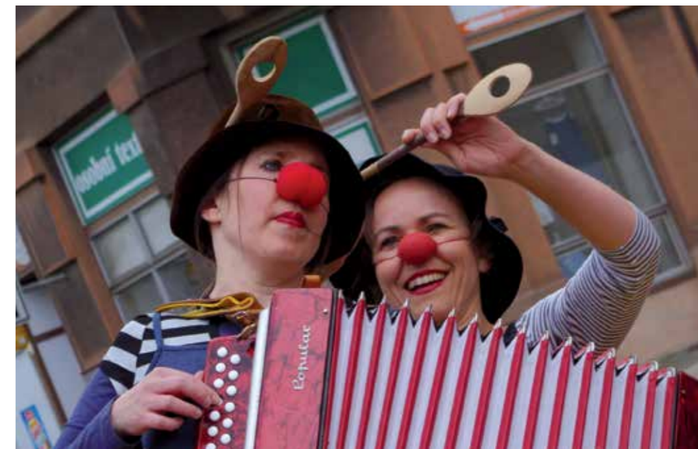
Divadlo na ulici – jeden z letošních projektů, podpořených z grantového systému města.

Materiál uvádí výčet konkrétních výhod příspěvkové organizace jako je: přímé řízení prostřednictvím odboru, přímý vliv na chod organizace, přehledná a rychlá zpětná vazba. Všechny tyto „výhody“ ale ve skutečnosti zvyšují negativní politickou závislost organizace s přímým spojením s vládnoucí garniturou. Dlouhodobě problematické je také přímé navázání na rozpočet města, které může vést v důsledku k neefektivnosti a ne hospodárnosti, a to také díky vnitřním předpisům města. Jedná se například o nutnost dodržet tabulkové platy, nemožnost větší motivace k výkonům, dle vnitřních směrnic města každou zá-