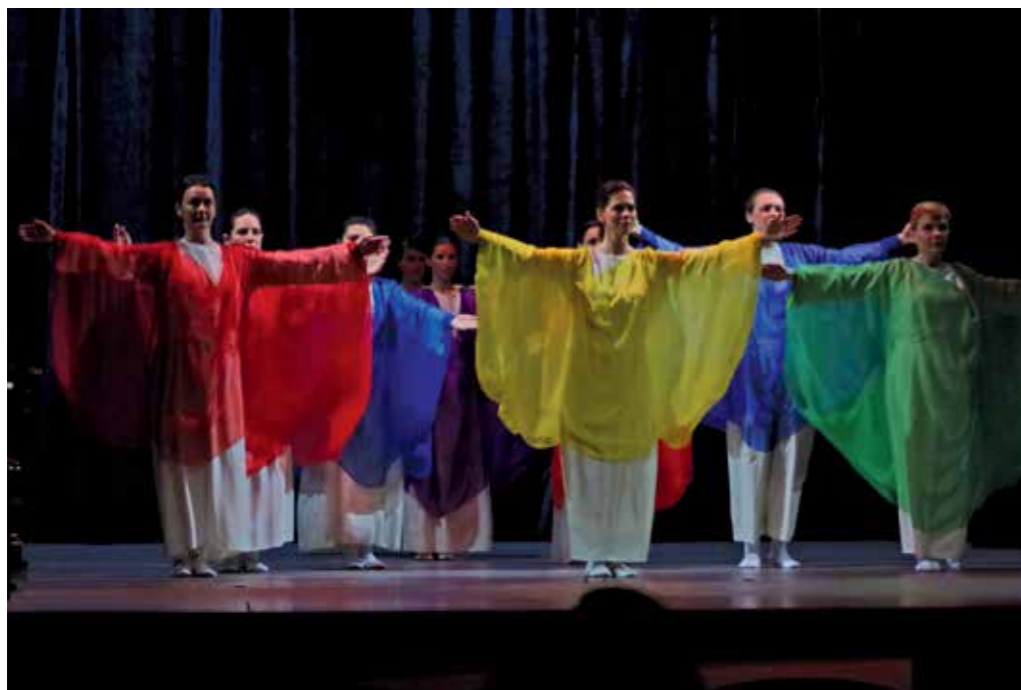
Květnové absolventské představení studentek eurytmie v Divadle Fráni Šrámka.