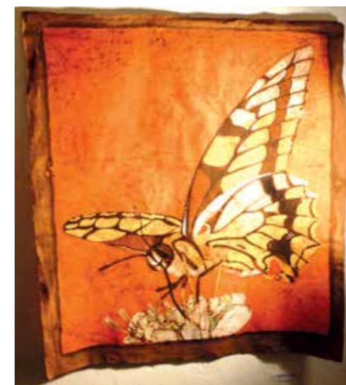
Motýl 2 – vosková batika.

Dlouho trvalo, než Alena Pintýřová začala sama vystavovat. Zato stejně dlouho přikládala ruce a um při instalacích výstav jiných. Jak těch nejznámějších současných českých výtvarníků, tak i začínajících amatérů – se stejnou laskavostí a snahou dát vyniknout alespoň nějakému drobečku inteligentní krásy a talentu.