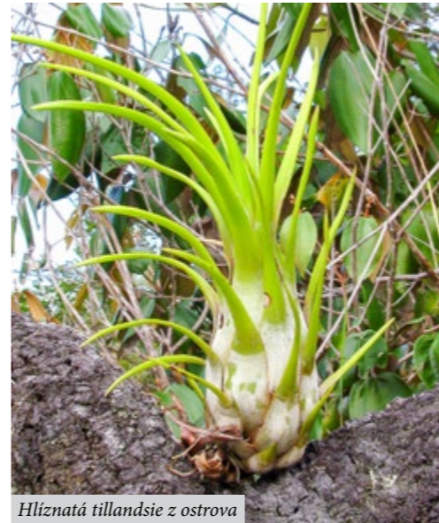
Hlíznatá tillandsie z ostrova