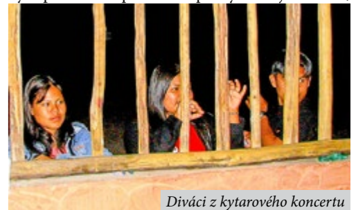
Diváci z kytarového koncertu

ře, čekalo nás tam seznámení se vzácným úlovkem netopýra nosatého ( Rhynchonycteris naso ). Je to druh zvláštní ve dvou věcech. Na rozdíl od většiny netopýrů nespí zavěšen na větvích hlavou dolů, ale přitisknut ke kmenům stromů. Tam se osvědčila druhá u netopýrů neobvyklá věc, a sice srst vyrůstající i na létacích blánách. Protože je malý a zbarvením srsti připomíná lišejníky, splývá s podkladem a tak je dobře maskovaný a tím chráněný před predátory. Zrovna jsme se chystali bourat stany a balit, když proti proudu připlul od vesnice indián na dlabané kánoi. Domnívali jsme se, že jde o návštěvu zvědavce, který se bude chtít družít. Ale on si nás vůbec nevnímal. Nalovil si v túni podobákem s jemnou síťovinou rybky a zase odplul. Zřejmě šlo o maso k večeri. Některé se nám přičilo, že pestrobarevné akvariální ryby nemusí sloužit jen k potěše oka, ale mohou mít i praktické využití. Když jsme dorazili do vsi, bylo našim prvním úkolem vyhledání někoho, kdo nás zítřa vezme na Roraimu. Bez místního průvodce se tam totiž nemáme. A kam jinam by si šel Čech pro radu, než do hospody? Na náš dotaz hostinský odpověděl: „Už nikoho nemusíte shánět, už průvodce máte, jsem to já.“ Ještě dohodnout cenu a pro dnešek máme po starosti. Stalo se a smlouva byla zaplata plechovkovým pivem. Hospoda nám poskytne nejen večeri,