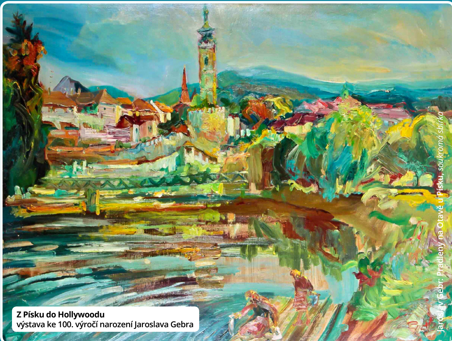
Jaroslav Gebra: Pradleny na Otavě u Písku, soukromá sbírka

Z Písku do Hollywoodu výstava ke 100. výročí narození Jaroslava Gebra