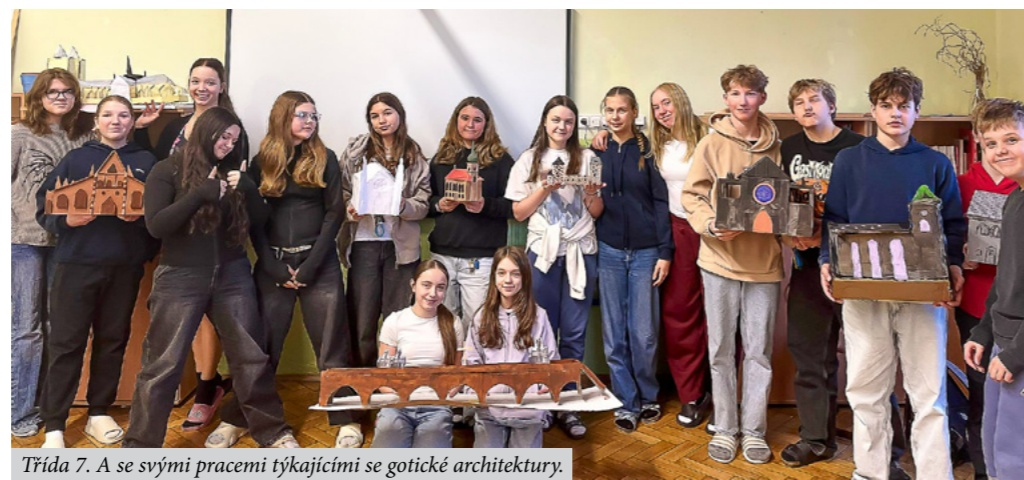
Třída 7. A se svými pracemi týkajícími se gotické architektury.