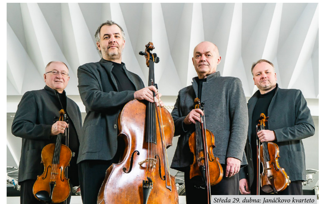
Středa 29. dubna: Janáčkovovo kvarteto