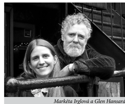
Markéta Irglová a Glen Hansard

V souvislosti s jarními koncerty Markéty Irglové v Česku, mezi kterými bude i vystoupení v píseckém Divadle Fráni Šrámka 21. dubna , jsme Markétu požádali o následující rozhovor.