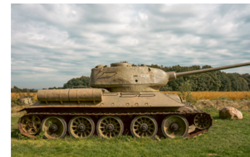
Legendární tank T-34/85 ve vojenském muzeu v Darkovičkách

Náš výcvik se v době studia odehrával ve cvikovém středisku v Motole. Byly mu obětovány pondělky. Uniformy jsme měli doma. Jednalo se o uniformy vyřazené z armády a ne vždy odpovídaly našim velikostem. Nelze se proto divit, že nám moc slušely, zvláště když byly doplněny sepranými návleky (spinkami) na botách. Proto jsme byli v tramvajích předmětem obdivu. Zvláště když nám hlavy jako třešnička na dortu zdobi-