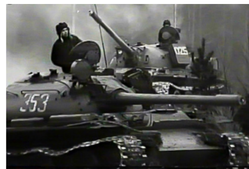
Z časosběrného dokumentárního filmu „Tankistův rok 1968“.

Objevili jsme u řeky Klabavy skryté místo, dokonce nepřilíží vzdálené od města. Počasí bylo teplé, takže to bylo docela fajn. Koupali jsme se samozřejmě „na Adama“. Byli jsme sami mezi sebou a také už jsme se znali ze sprch. Jak se ale po několika dnech ukázalo, ani tento způsob našeho využití volného času nebyl bezproblémový. Na kobereček si nás pozval velitel útvaru. Nevěděli jsme proč, ale záhy nám to bylo objasněno. Šlo o to naše koupání. Ukázalo se, že nás náhodně objevila dcera starosty. Ta to tichou poštou poslala dál, až se z našeho koupání stala atrakce pro pubertální dívky. Jenže jak to u holek bývá, nic se v tajnosti neudrželo a naše nemravné konání řešil stranický výbor KSČ města Strašice. Byli jsme obviněni z narušování mravní výchovy nezletilých