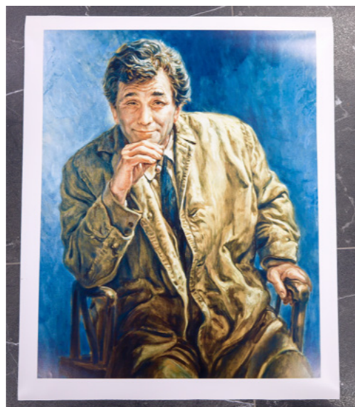
Portrét herce Petera Falka, velkoformátový tisk

V roce 1984 mu bylo uděleno nejvyšší uznání za celoživotní práci ve filmovém průmyslu a byl jmenován členem Filmové akademie, která každoročně uděluje „Oscary“.