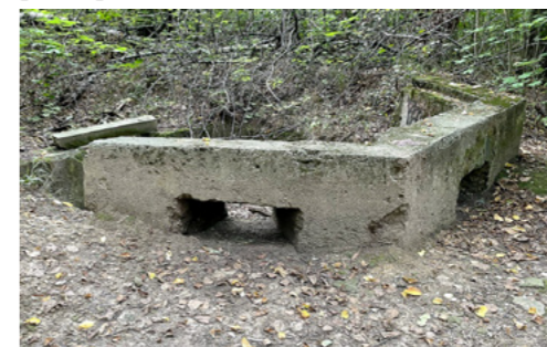
V blízkosti Fakultní nemocnice v Motole jsou dodnes patrné zbytky objektů bývalého vojenského cvičiště.

Tak jsem se stal tankistou, vlastně v rozporu s vojenskými předpisy. Přemýšlel jsem, proč zrovna přírodovědcům byla přisouzena tato zbraň a pak mi to došlo. Profese přírodovědce je ve válce nejspíš zbytečná. Užiteční bychom mohli být třeba jako spojari s poštovními holubami, ale ti už byli nahrazeni technikou. Průměrná životnost posádky tanku (4 vojáci) byla odhadována na 4 minuty, takže si nejspíš moc nezabojujeme. Tank je taková rachotící, burácející a skřípající rakev, která se těžko v terénu schová, takže nás snadno zlikviduje ze zákopu pěšák s panzerfaustem (jeho čas přežití je násobně vyšší než u tankistů). Tím se potvrdil můj předpoklad, že biologové jsou prostě postradatelní.