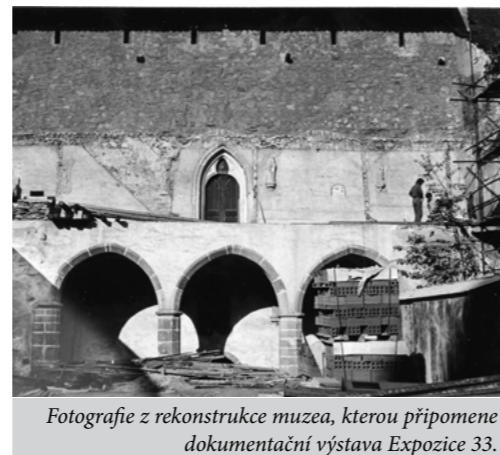
Fotografie z rekonstrukce muzea, kterou připomene dokumentační výstava Expozice 33.